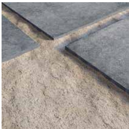
НА ПІСКУ SAND FIXING