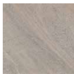
GRANITE STONE X604F7R