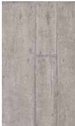
MALTA GREY X945E8R