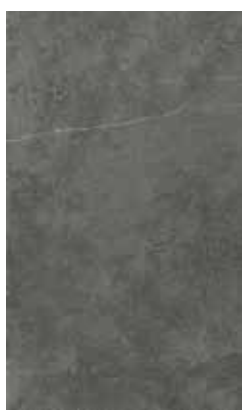
MISTIQUE BLACK X943U9R