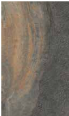
SLATE MULTICOLOR X944F2R