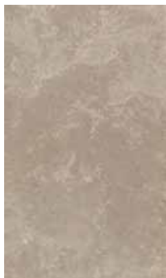
NUDE BEIGE X943U3R