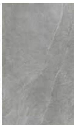
SLATE GREY X944F8R