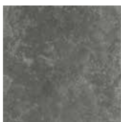
MISTIQUE BLACK X603U9R