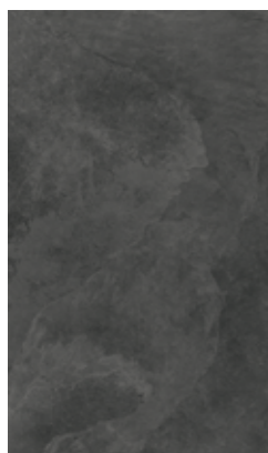
SLATE BLACK X944F9R