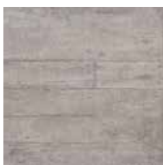
MALTA GREY X605E8R