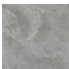
SLATE GREY X604F8R