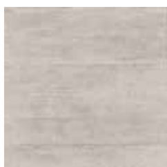
FANGO SAND X605E3R