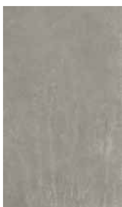
BRIGHT GREY X943U8R