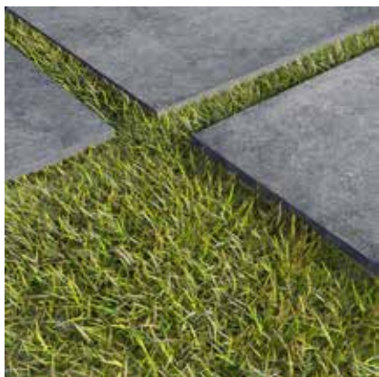
НА ТРАВІ GRASS FIXING